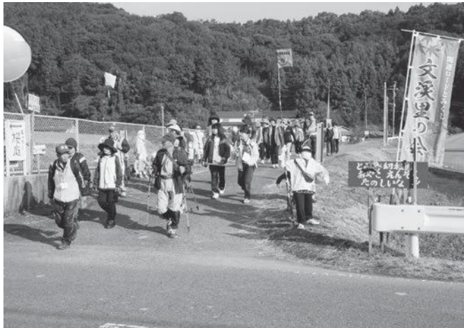
地域おこし協議会主催のウォークの様子

関係部署の職員を集めて災害対応会議を開催し、職員に対する防災教育の強化、自主防災組織との連携強化等、数多くの項目による反省点、そして改善策を協議しました。