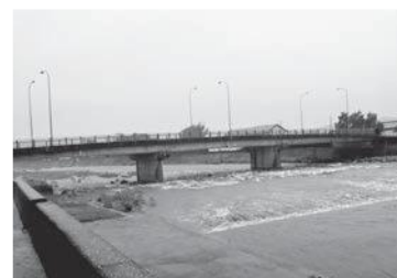
安岐中央大橋のようす

市内に7カ所あり、伊美川、田深川、武蔵川、安岐川、荒木川の5カ所。今年度、岐部川、吉弘川の2カ所に設置しています。県の管理河川です。市の管理河川には今後の設置予定はありません。