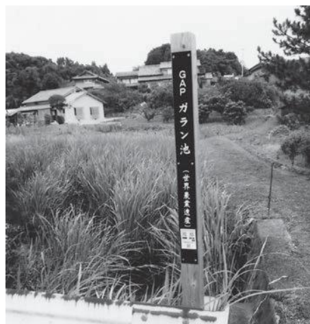
雑草が生い茂るガラン池

観光課としては、伐採手数料とかは確保していますが、池の泥をさらえることは、過去にも例がありませんし、有効な補助金もございません。また、そういう事業がございません。周辺整備だけをお願いします。