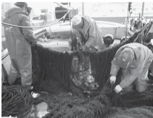
安岐沖でのヒジキ試験養殖の収穫

す。その他の魚種については、市、県、漁業公社が放流事業を実施しています。魚種は、7種で29年度の放流実績は、約36万尾となっています。