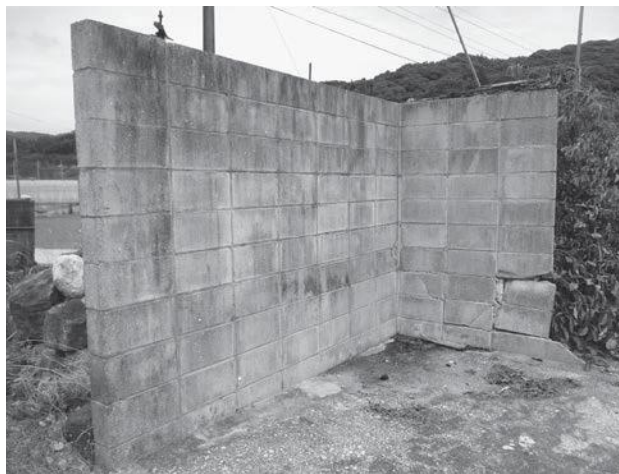
危険性のあるブロック塀

大幅に変更があり関係団体等に影響を与える場合は、事前に説明会を開きたいと考えています。