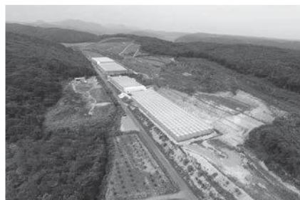
常緑果樹研修所跡地への進出企業