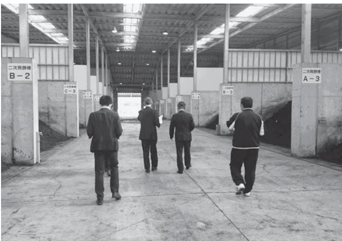
平成22年 臼杵市に建設された堆肥舎施設

安心安全な農産物を作るには、土づくりが重要です。里山からの雑木や落ち葉、家畜の糞尿で作った高品質な堆肥で土づくりをし、安心安全な高付加価値の野菜等を生産し販売します。また、子どもたちの給食にも提供していきたいと考えています。